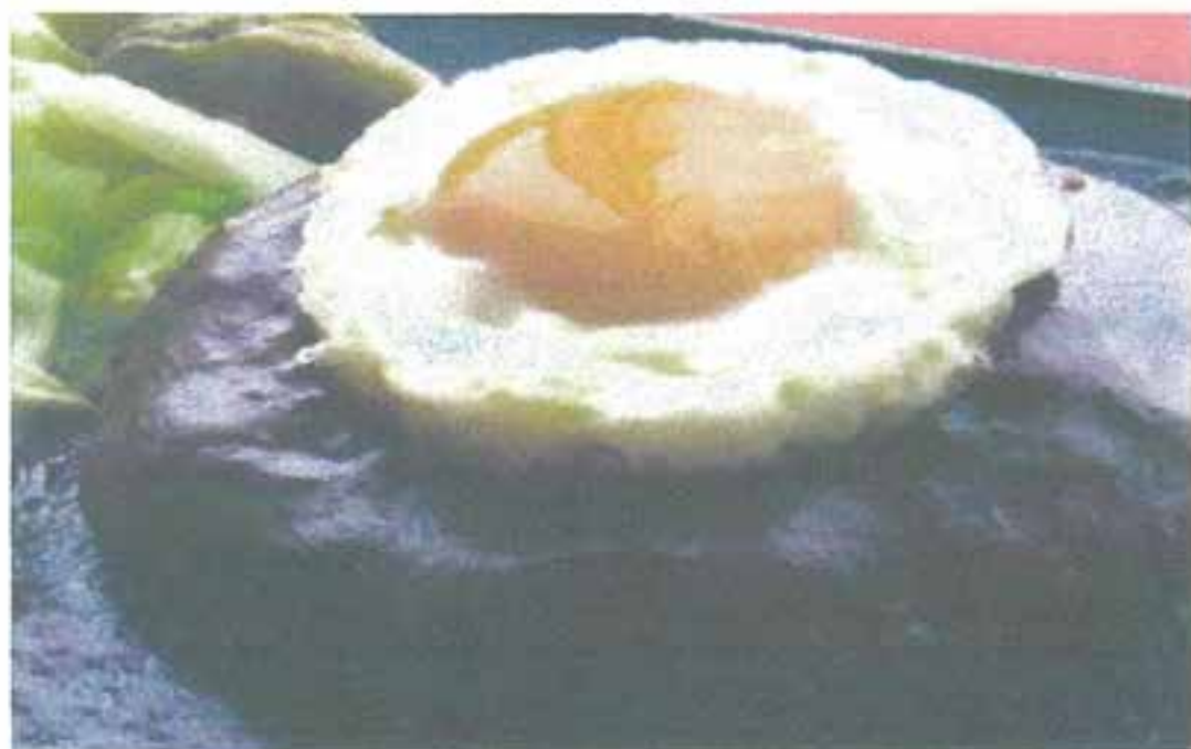
ハンバーグステーキ (250g) ライス別 ¥1160