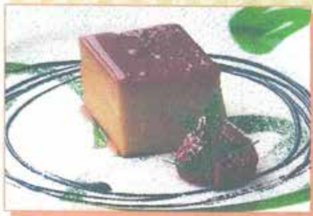
カボチャのキャラメルプリン ¥600