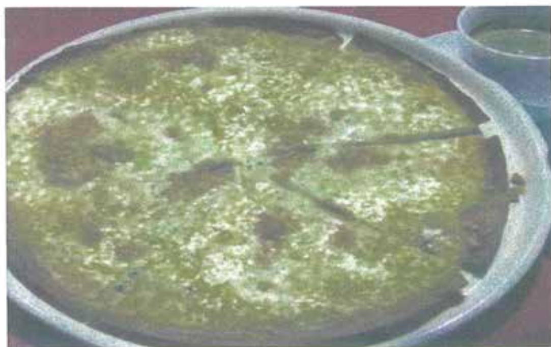
クアトロ・フォルマッジ ¥1060